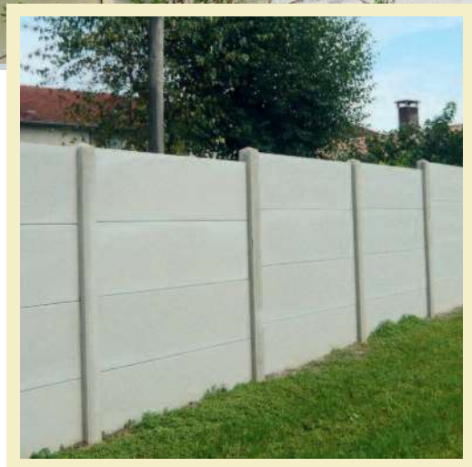
Clôture écran classique pour ligne d'horizon