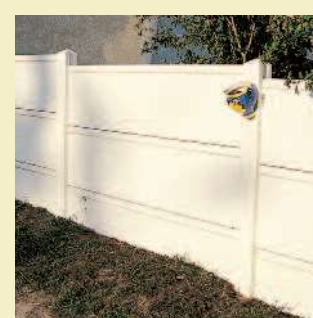
Variante avec plaque 1/2 chaperonnée